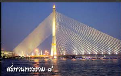
สะพานพระราม ๘