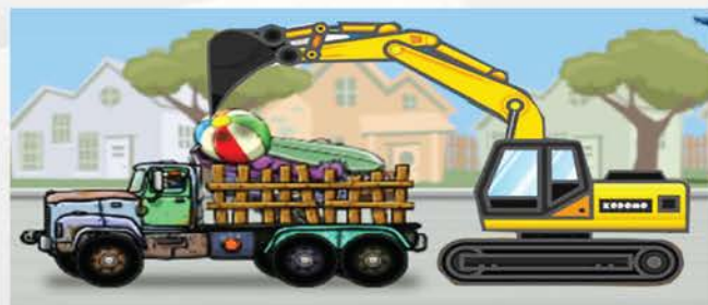
ข้อเสนอแนะ

Δ องค์การปกครองส่วนท้องถิ่นจ่ายขาดเงินสะสมเป็นค่าจ้างเหมาซ่อมแซมรถบรรทุกเท้าย และจ้างเหมาซ่อมแซมรถบรรทุกน้ำ โดยที่ครุภัณฑ์ยานพาหนะทั้งสองรายการดังกล่าวไม่ปรากฏในทะเบียนคุมพัสดุครุภัณฑ์ขององค์การปกครองส่วนท้องถิ่น จึงไม่ใช่ครุภัณฑ์ยานพาหนะที่จะสามารถดำเนินการบำรุงรักษาให้เป็นไปตามระเบียบกระทรวงมหาดไทย ว่าด้วยการใช้และรักษารถยนต์ขององค์การปกครองส่วนท้องถิ่น พ.ศ.2548 ข้อ 16 ที่กำหนดให้องค์กรปกครองส่วนท้องถิ่น มีหน้าที่รับผิดชอบการซ่อมบำรุงรถประจำตำแหน่ง รถส่วนกลาง และรถรับรองให้อยู่ในสภาพพร้อมใช้งานได้ดีอยู่เสมอ และการดำเนินการดังกล่าวกำหนดให้ใช้ วิธีการตามระเบียบกระทรวงมหาดไทย ว่าด้วยการพัสดุของหน่วยการบริการราชการส่วนท้องถิ่น พ.ศ. 2535 และแก้ไขเพิ่มเติม (ฉบับที่ 9) พ.ศ. 2553 ต่อไป