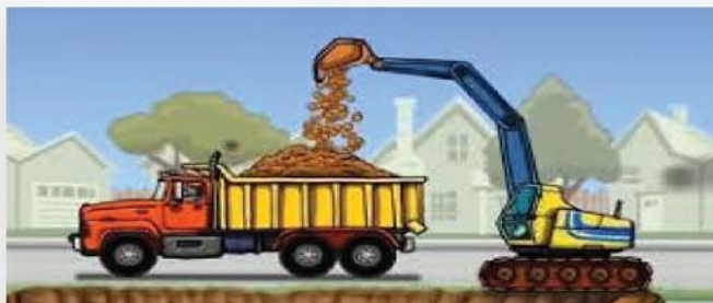
ข้อบกพร่องที่ตรวจพบ

ในฉบับนี้หน่วยตรวจสอบภายใน ได้นำเสนอตัวอย่างข้อบกพร่องของ สตง. มาให้ผู้ที่สนใจได้เป็นแนวทางในการปฏิบัติงาน และในฉบับต่อไปจะได้นำตัวอย่างข้อบกพร่องมานำเสนอแก่ผู้สนใจได้ติดตามต่อไป