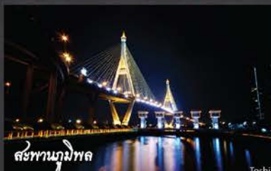
สะพานภูมิพล