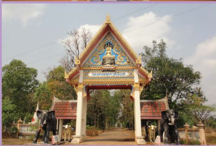
สถานที่ท่องเที่ยว : วัดอุดมคงคาคีรีเขต ที่อยู่ : หมู่ 6 ต.นางาม อ.มัญจาคีรี จ.ขอนแก่น เวลาเปิดทำการ : เปิดบริการทุกวัน ตลอด 24 ชม.