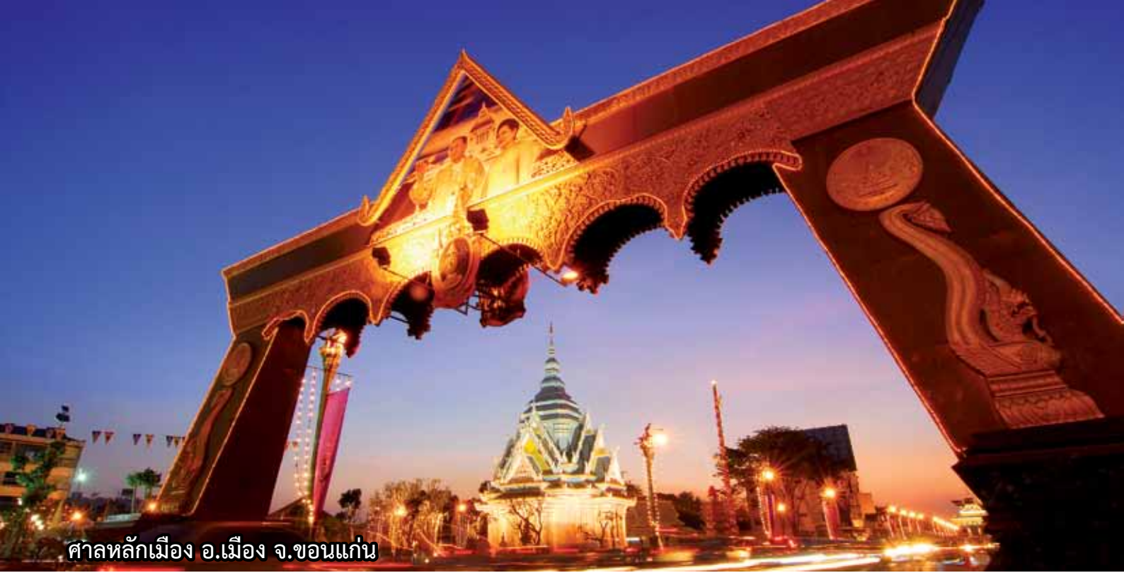
ศาลหลักเมือง อ.เมือง จ.ขอนแก่น