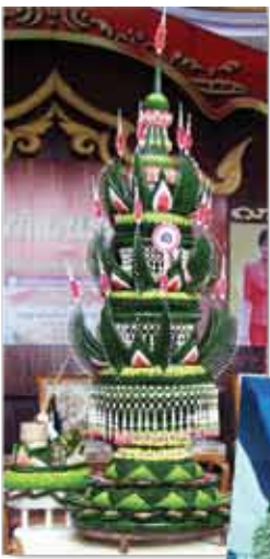
ชนะเลิศ การประกวดพานบายศรี ประชาชน