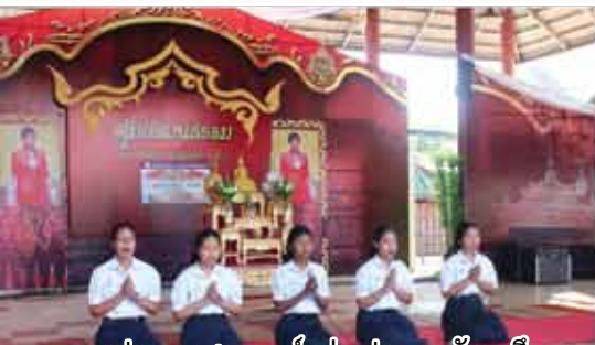
การประกวดสวดมนต์หมู่ฯ ประเภทมัธยมศึกษา