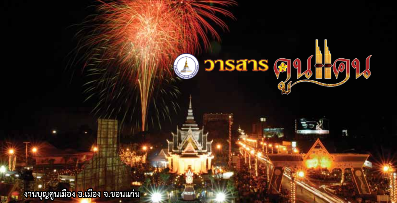
งานบุญคุณเมือง อ.เมือง จ.ขอนแก่น