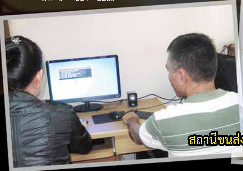
สถานีขนส่งฯ อ.ชุมแพ