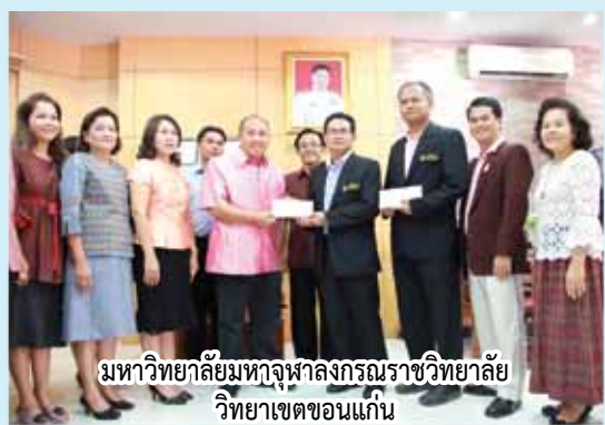
มหาวิทยาลัยมหาจุฬาลงกรณราชวิทยาลัย วิทยาเขตขอนแก่น