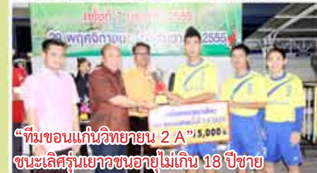
“ทีมขอนแก่นวิทยายน 2 A” ชนะเลิศรุ่นเยาวชนอายุไม่เกิน 18 ปีชาย