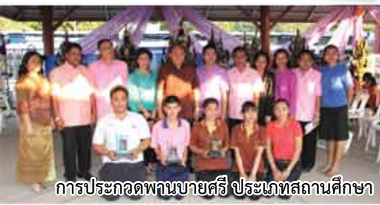
การประกวดพานบายศรี ประเภทสถานศึกษา