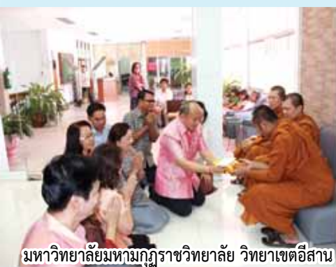
มหาวิทยาลัยมหามกุฏราชวิทยาลัย วิทยาเขตอีสาน