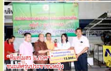
“ทีมสโมสร ม.ภาคฯ” ชนะเลิศรุ่นประชาชนหญิง