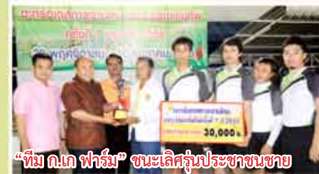
“ทีม ก.เภ ฟาร์ม” ชนะเลิศรุ่นประชาชนชาย