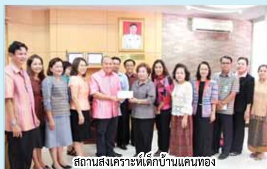
สถานส่งเสริมเด็กบ้านแคนทอง