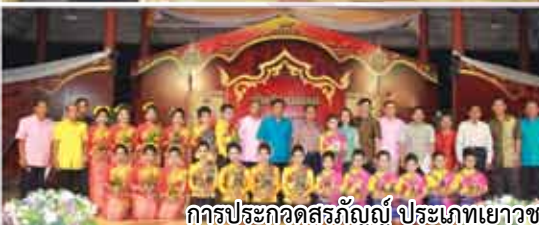
การประกวดสรภัญญ์ ประเภทเยาวชน