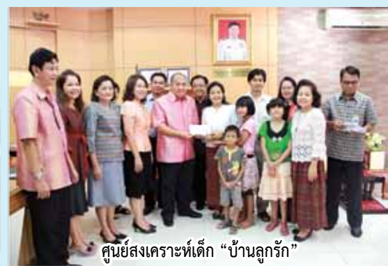
ศูนย์ส่งเสริมเด็ก "บ้านลูกรัก"