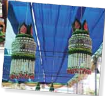
ชนะเลิศการประกวด โคมแขวนชั้นหมากเบ็ง