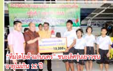
“ทีมโตโยต้าแก่นนคร” ชนะเลิศรุ่นเยาวชนอายุไม่เกิน 12 ปี