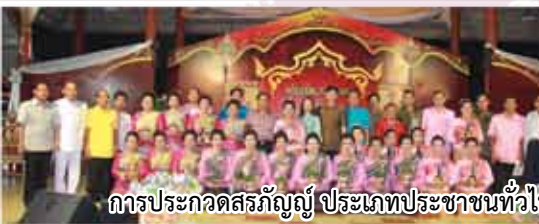
การประกวดสรภัญญ์ ประเภทประชาชนทั่วไป