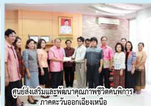
ศูนย์ส่งเสริมและพัฒนาคุณภาพชีวิตคนพิการ ภาคตะวันออกเฉียงเหนือ