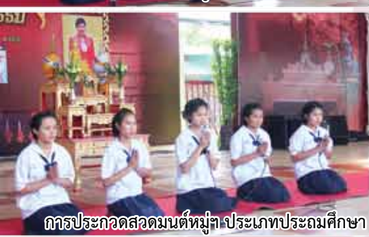
การประกวดสวดมนต์หมู่ฯ ประเภทประถมศึกษา