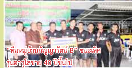
“ทีมหมู่บ้านกัญญารัตน์ B” ชนะเลิศรุ่นอาวุโสชาย 40 ปีขึ้นไป