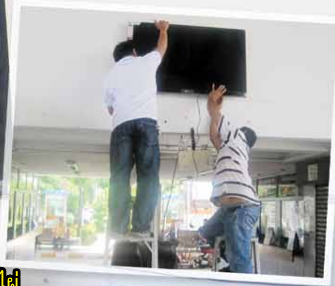
สถานีขนส่งฯ อ.บ้านไผ่