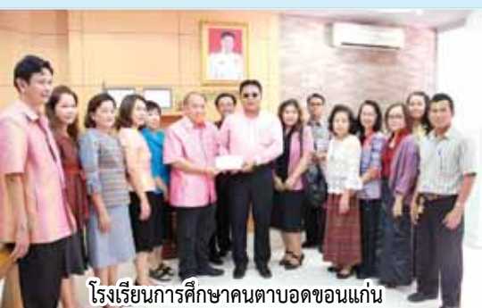
โรงเรียนการศึกษาคนตาบอดขอนแก่น