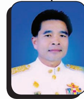
นายมีสวัสดิ์ ชมชัยภูมิ รองประธานสภาฯ คนที่ 2