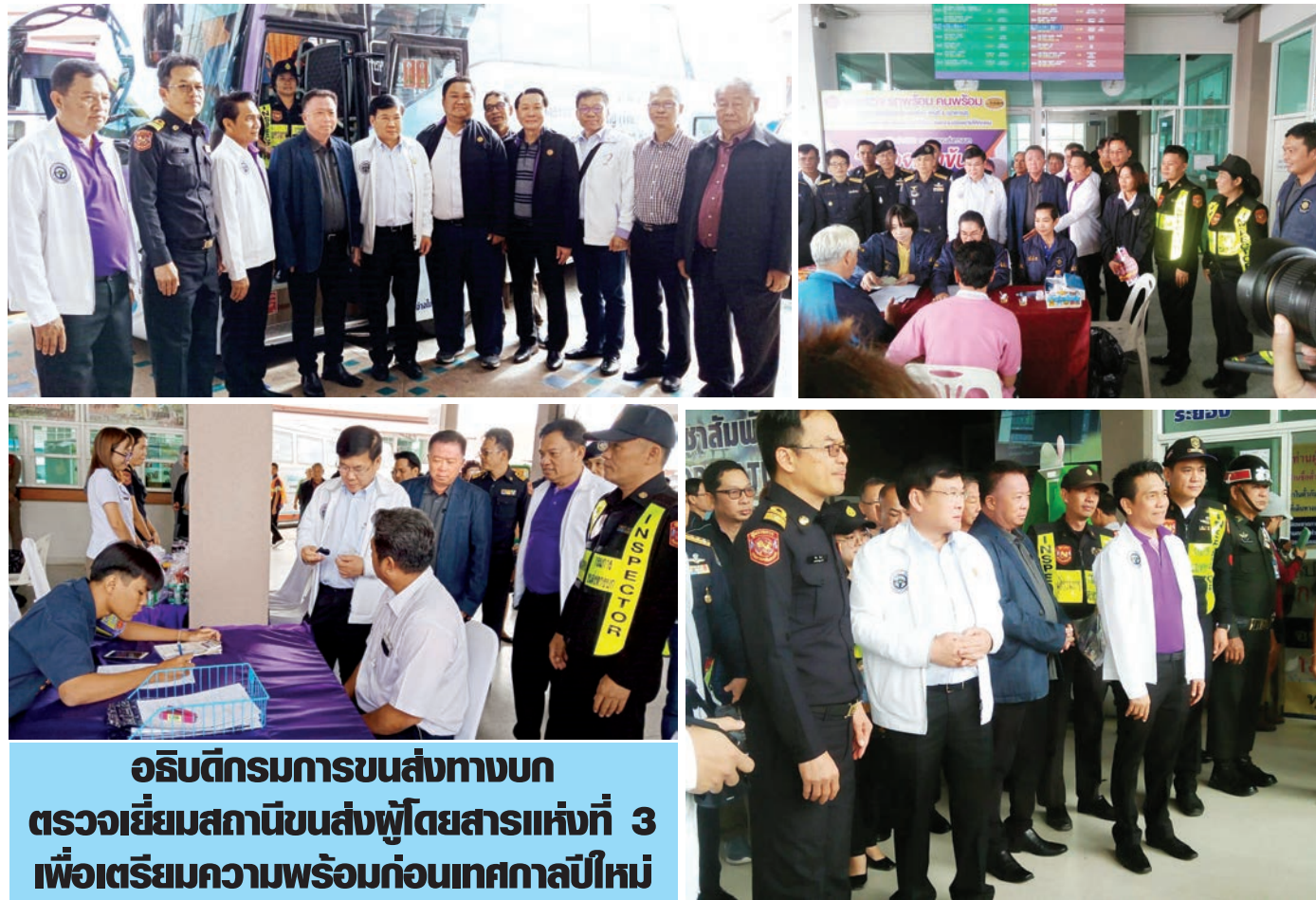
อธิบดีกรมการขนส่งทางบก ตรวจเยี่ยมสถานีขนส่งผู้โดยสารแห่งที่ 3 เพื่อเตรียมความพร้อมก่อนเทศกาลปีใหม่