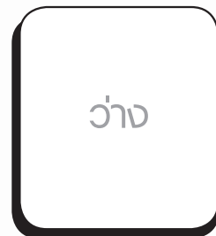
ว่าง อ.ชุมแพ เขต 1