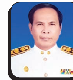
ดร.เกียรติคุณ จันทน์ พ.อ.สำนักการศึกษา ศาสนาและวัฒนธรรม