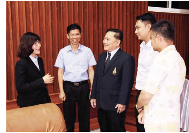
โครงการสัมมนาเชิงปฏิบัติการ สร้างขอนแก่นให้เป็นเมืองนิเวศน์ ด้วยแนวทางการพัฒนา