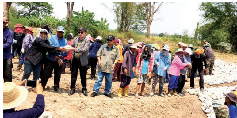
โครงการก่อสร้างฝายเสริมสร้างระบบนิเวศต้นน้ำและ ฝายหินทิ้งแบบประชาอาสา