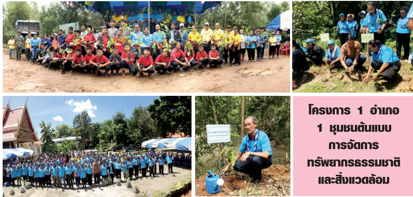
โครงการ 1 อำเภอ 1 ชุมชนต้นแบบ การจัดการ ทรัพยากรธรรมชาติ และสิ่งแวดล้อม