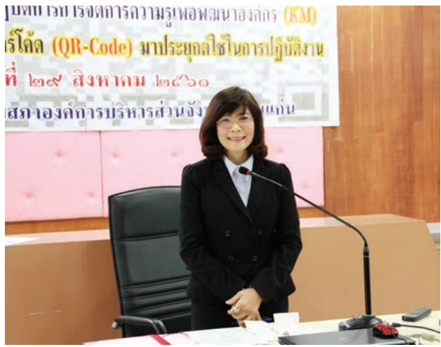
โครงการอบรมเชิงปฏิบัติการ การจัดการความรู้เพื่อพัฒนาองค์กร การนำความรู้เทคโนโลยี คิวอาร์โค้ด มาประยุกต์ใช้ในการปฏิบัติงาน