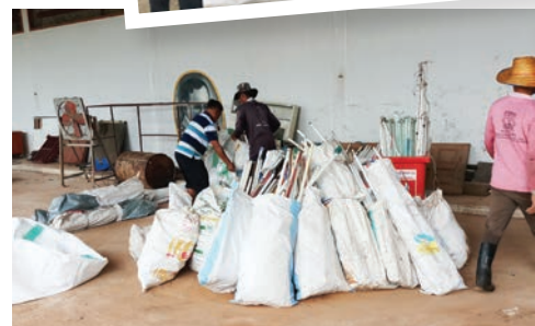
การบริหารจัดการขยะและของเสียอันตราย จังหวัดขอนแก่น