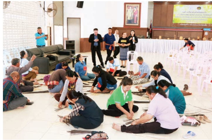
โครงการอบรมส่งเสริมพัฒนาศักยภาพ ในการฝึกอาชีพให้กับกลุ่มผู้สูงอายุ และประชาชนทั่วไป