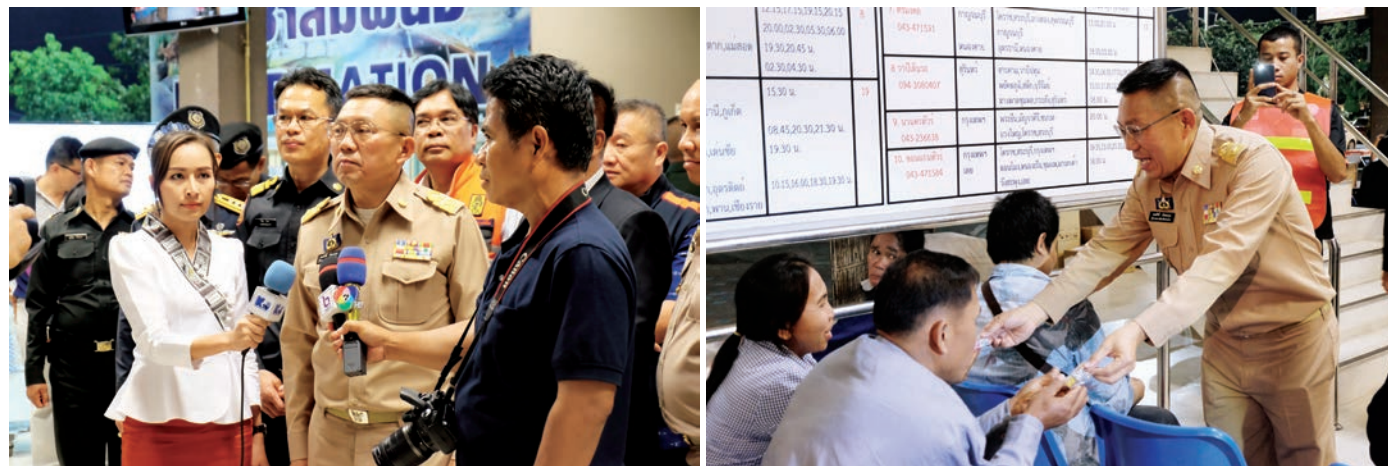
ผู้ว่าราชการจังหวัดขอนแก่นตรวจเยี่ยม สถานีขนส่งผู้โดยสารแห่งที่ 3 เพื่อเตรียมความพร้อมก่อนเทศกาลปีใหม่