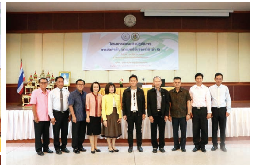
โครงการอบรมเชิงปฏิบัติการ การจัดทำสัญญาแบบปรับราคาได้ (ค่า K)