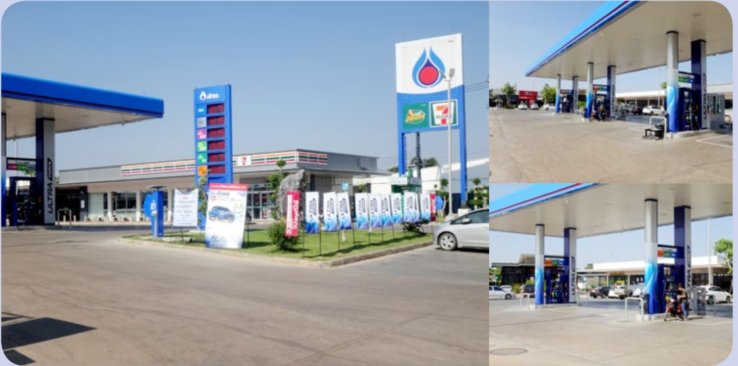
บริษัท สามมิตร ออยล์ จำกัด

ที่ได้จดทะเบียนและชำระภาษีน้ำมันให้องค์การบริหารส่วนจังหวัดขอนแก่น