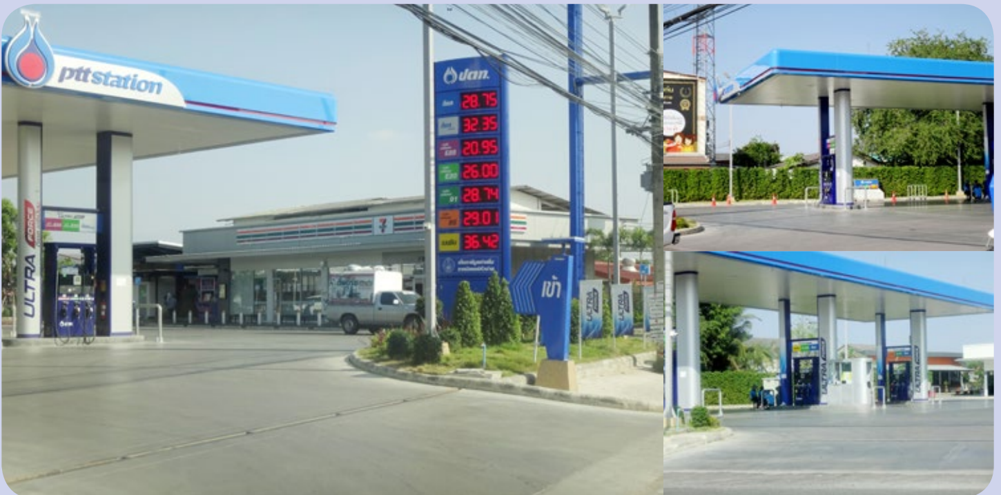
บริษัท เอ็น แอนด์ อาย ปีโตรเลียม จำกัด

ตั้งอยู่เลขที่ 885 หมู่ 15 บ้านเกษร ต.ศิลา อ.เมืองขอนแก่น จ.ขอนแก่น โทร. 081-3801665