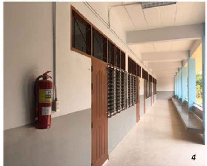
ภาพที่ 1 - 4 โครงการก่อสร้างอาคารเรียน 3 ชั้น โรงเรียนพุวัตพิทยาคม อ.อุบลรัตน์ จ.ขอนแก่น