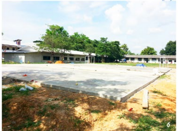
ภาพที่ 5 - 6 ภาพความคืบหน้าโครงการก่อสร้างอาคารบ้านพักนักกีฬา และสนามฟุตบอล โรงเรียนหนองโนประชาสรรค์