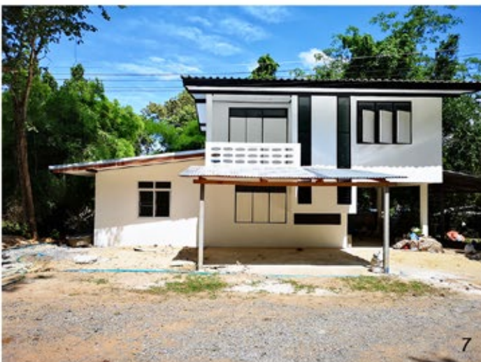
ภาพที่ 7 งานปรับปรุงและต่อเติมบ้านพักครู โรงเรียนศรีเสมาวิทยาเสริม