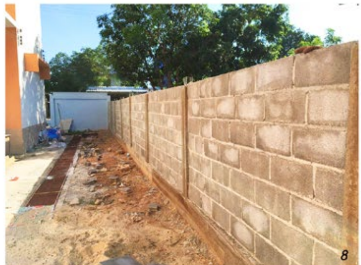
ภาพที่ 8 โครงการก่อสร้างรั้วโรงเรียนบ้านหนองเสี้ยว