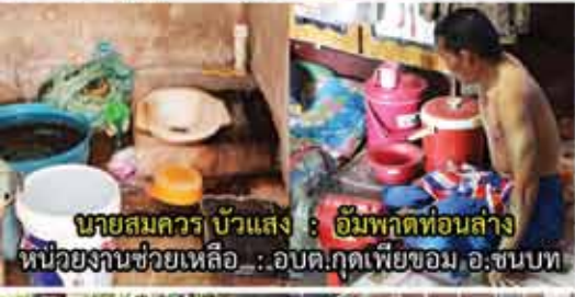
นายสมควร บัวแสง : อัมพาตท่อนล่าง หน่วยงานช่วยเหลือ : อบต.กุดเพียงอม อ.ชนบท