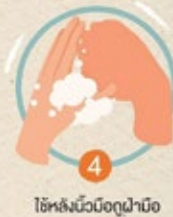
4 ใช้หลังนิ้วมือถูฝ่ามือ