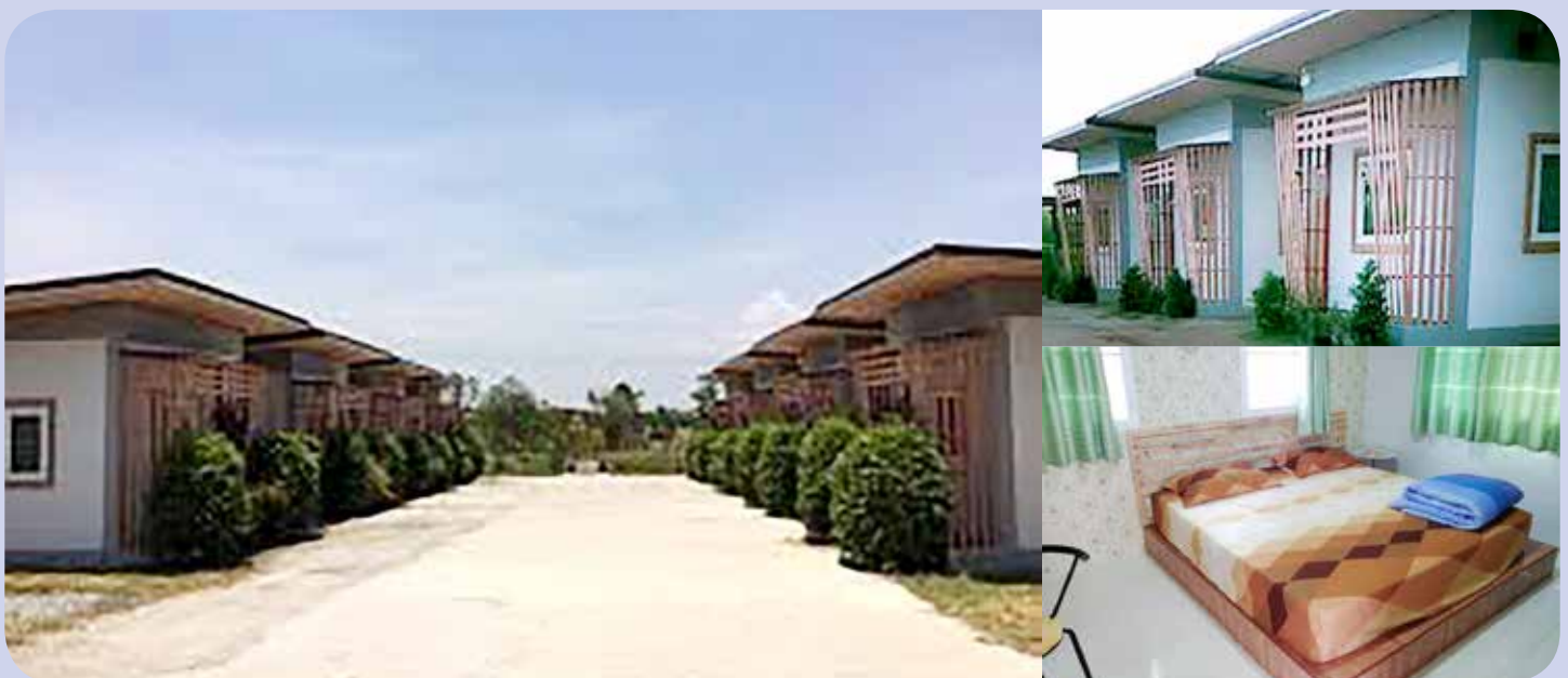
โรงแรมวรรณวีรีสอร์ท

ที่อยู่ 333 หมู่ที่ 8 ถนนมะลิวัลย์ ตำบลชุมแพ อำเภอชุมแพ จังหวัดขอนแก่น โทร 043-313333