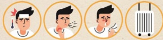
มีไข้ ไอ จาม มีน้ำมูก เพิ่งกลับจากพื้นที่เสี่ยง

ยิ่งรู้เร็ว! ลดการแพร่เชื้อ! เช็กอาการตามนี้!