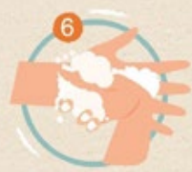
6 ใช้ปลายนิ้วมือถูขวางฝ่ามือ