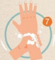
5 ใช้ฝ่ามือถูรอบข้อมือ