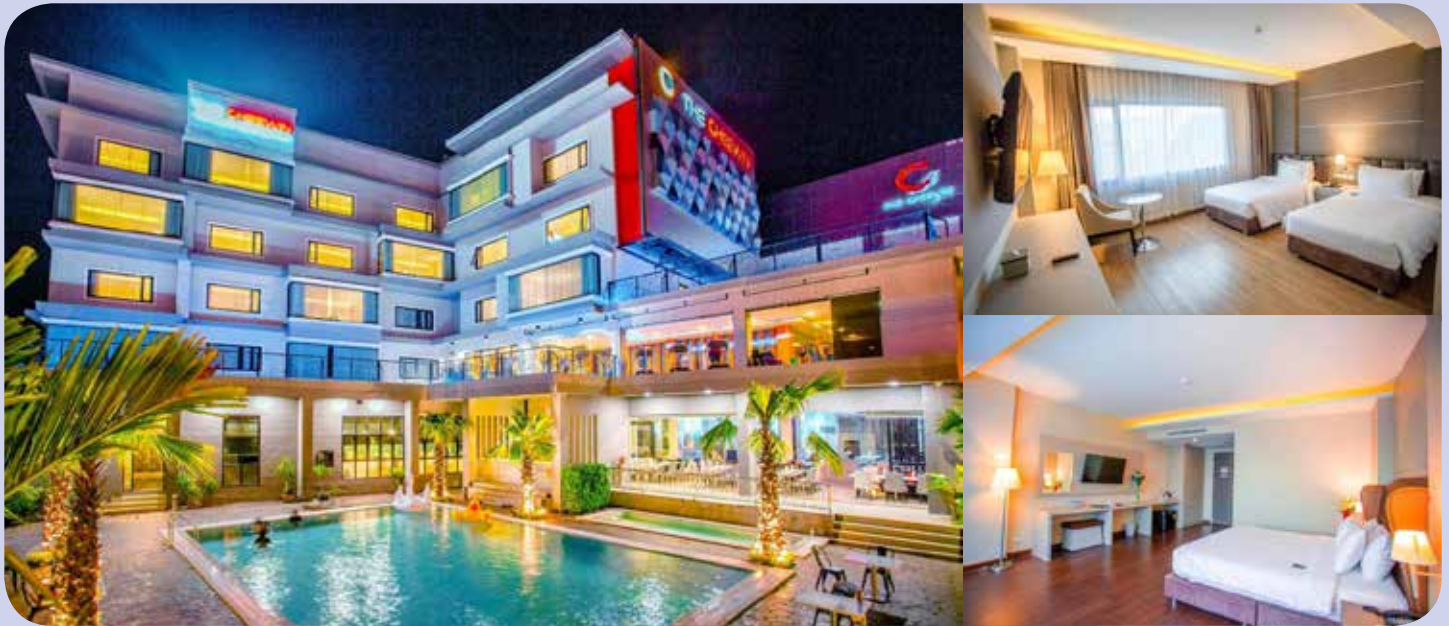
โรงแรมเดอะซีวิลไฮเทลแอนด์คอนเวนชั่น

ที่อยู่ 333 หมู่ที่ 8 ถนนมะลิวัลย์ ตำบลชุมแพ อำเภอชุมแพ จังหวัดขอนแก่น โทร 043-313333