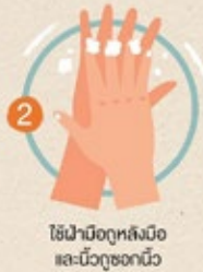
2 ใช้ฝ่ามือถูหลังมือและนิ้วถูข้อมือ