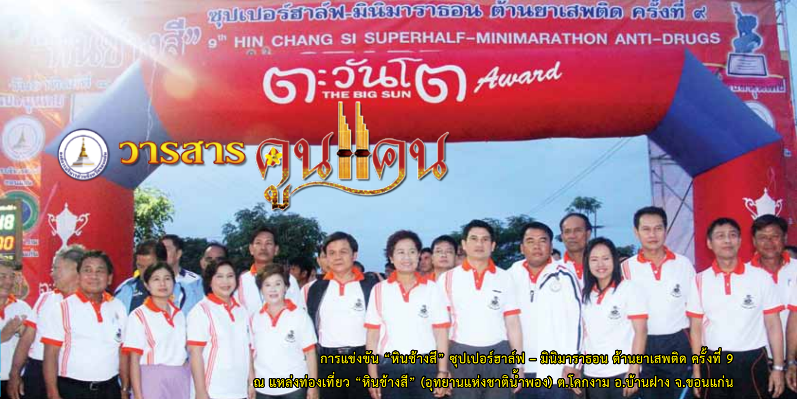
การแข่งขัน “หินช้างสี” ซุปเปอร์ฮาล์ฟ – มินิมาราธอน ด้านยาเสพติด ครั้งที่ 9 ณ แหล่งท่องเที่ยว “หินช้างสี” (อุทยานแห่งชาติน้ำพอง) ต.โคกงาม อ.บ้านฝาง จ.ขอนแก่น