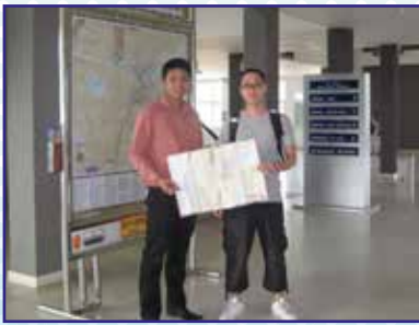
ให้บริการข้อมูลข่าวสาร การท่องเที่ยวและการเดินทางแก่ผู้ใช้บริการสถานีขนส่งฯ