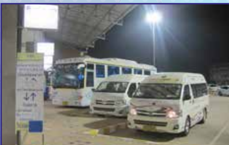
รถตู้โดยสารประจำทาง