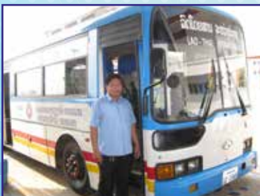
รถโดยสารระหว่างประเทศ ขอนแก่น-เวียงจันทร์