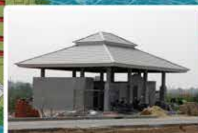
ทางก่อสร้างอาคารสุขา