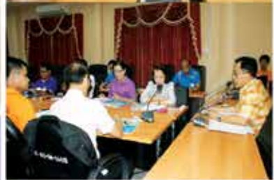
นำเสนอความคืบหน้าโครงการต่อคณะทำงานดำเนินงานพุทธมณฑลอีสานจังหวัดขอนแก่น เมื่อวันที่ 12 มี.ค.2557 ณ ห้องประชุมกองการศึกษา