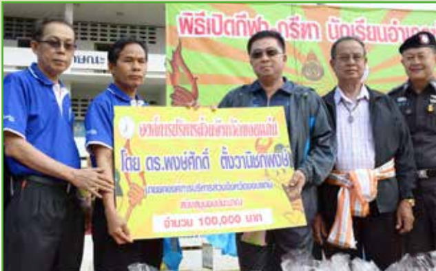
นายก อบจ.ขอนแก่น