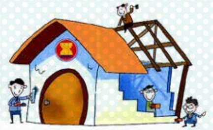
ASEAN ICT Masterplan 2015