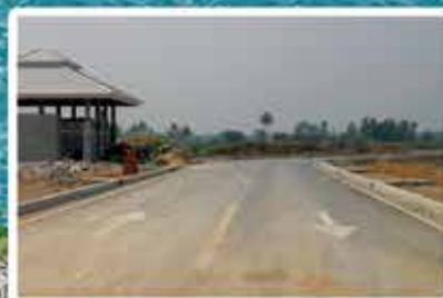
ถนนลาดยางรอบองค์พระฯ