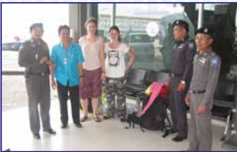
จนท.ตร. รักษาความปลอดภัยภายในสถานีขนส่งฯ