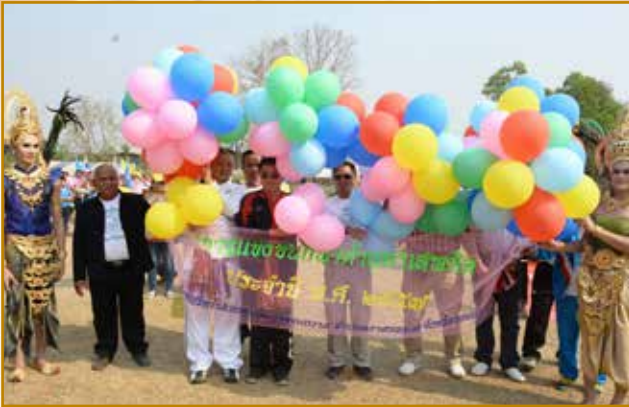
นายก อบจ.ขอนแก่น