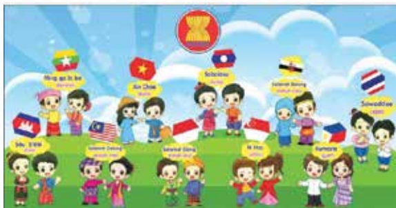
ASEAN ICT Masterplan 2015