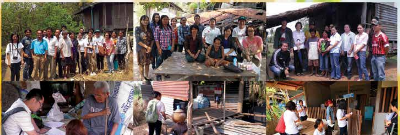
การอบรมเชิงปฏิบัติการ ระหว่างวันที่ 19 มี.ค. - 4 เม.ย.2557 โดยการออกเยี่ยม สสำรวจ และออกแบบปรับสภาพแวดล้อมที่อยู่อาศัยของคนพิการ ร่วมกับตัวแทนจาก อปท.ที่เข้าร่วมโครงการ และทีมวิทยากรจาก คณะสถาปัตยกรรมศาสตร์ มข. และสถาปนิกอาสา จากสมาคมศิษย์เก่า