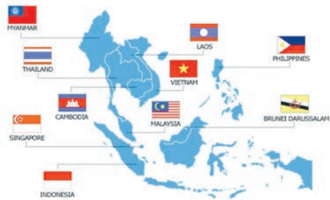
ASEAN ICT Masterplan 2015