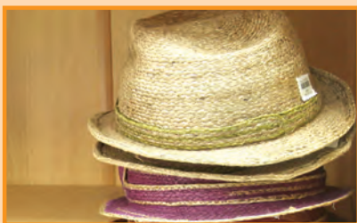
ผลิตภัณฑ์ : หมวกสาน

เปิดทำการวันจันทร์-วันเสาร์ เวลา 08.30-17.30 น.