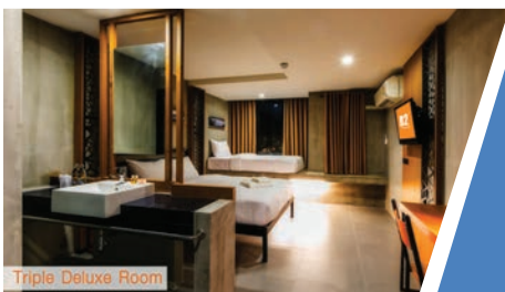
Triple Deluxe Room