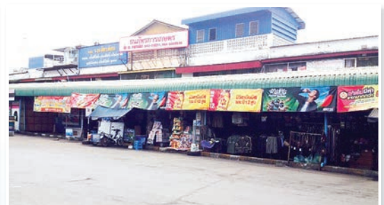
ป้ายโฆษณา