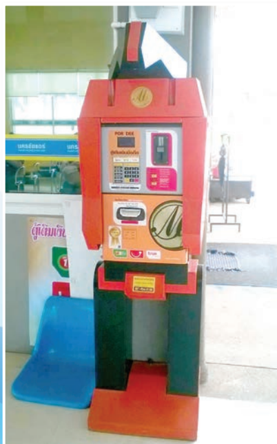
เติมเงินแบบออนไลน์