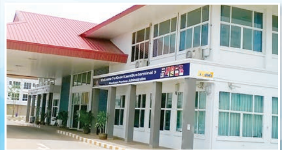
ติดตั้ง “3BB wifi”