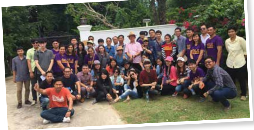
ที่มา : บทความ พลเอก ดร.จารุภัทร เรืองสุวรรณ