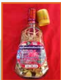
สมุนไพรวานน้อยร้อยฝ้าย

เปิดทำการวันจันทร์-วันเสาร์ เวลา 08.30-17.30 น.