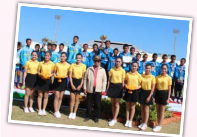
สรุปเหรียญรางวัลการแข่งขันกีฬานักเรียน อปท. ครั้งที่ 33 รอบคัดเลือกระดับภาคตะวันออกเฉียงเหนือ ไดโนเสาร์เกมส์ (อันดับ 1-10)