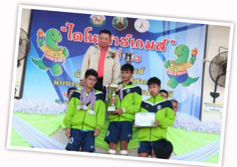
สรุปเหรียญรางวัลนักกีฬาคณะกรรมการบริหารส่วนจังหวัดขอนแก่น ระดับภาคตะวันออกเฉียงเหนือ ครั้งที่ 33