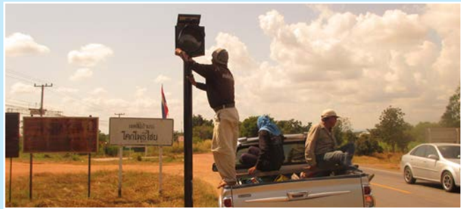
บ.หนองหญ้าแพรก-บ.โนนทัน