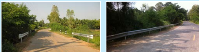
สาย ชนบท-ห้วยไร่