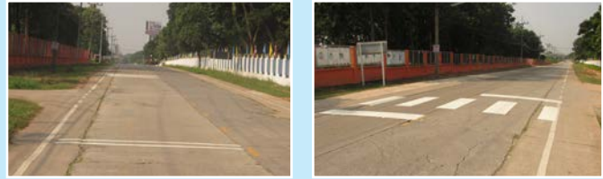
สาย แยกทางหลวงหมายเลข2-บ้านโคก