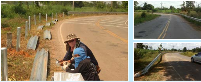
สาย ชก.3004 บ้านหนองบัวน้อย-บ้านกระนวน