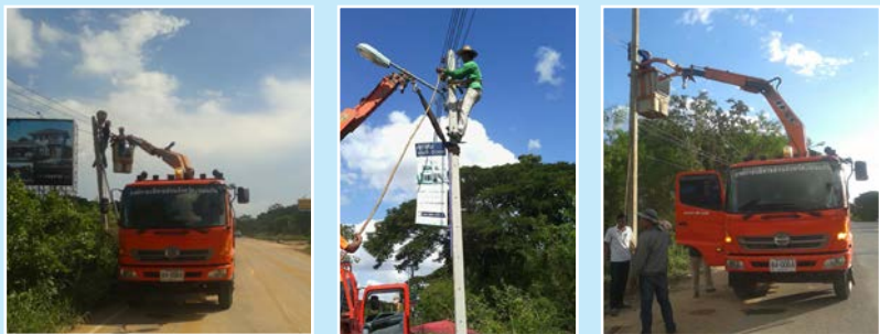
บ.หนองหญ้าแพรก-บ.โนนทัน