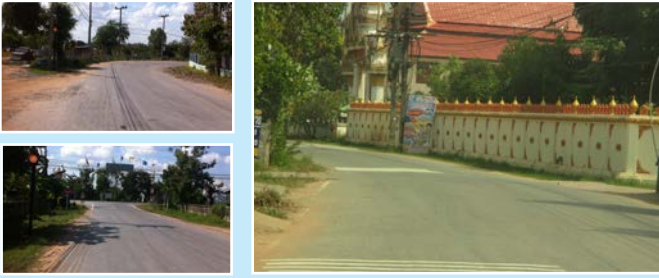
บ.หนองหญ้าแพรก-บ.โนนทัน

โดย : กรรชิ่ง เทศประสิทธิ์ ผอ.ส่วนพัฒนาโครงสร้างพื้นฐาน