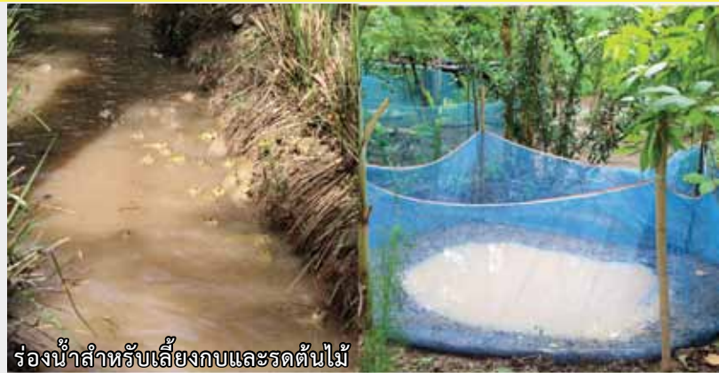
ร่องน้ำสำหรับเลี้ยงกบและรดต้นไม้

แนวความคิดการทำเศรษฐกิจพอเพียงของนายสมบุรณ์ จะมองเรื่องการขาดทุนก่อน ถ้าทำแล้วขายไม่ได้ จะแก้ปัญหาอย่างไร และต้องเริ่มทำให้เป็นไปตามขั้นตอน จากน้อย ไปหามาก และจะทำพื้นที่ 2 ไร่ ให้มีรายได้เท่ากับพื้นที่ 10 ไร่ ได้อย่างไร