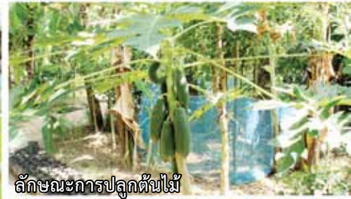
ลักษณะการปลูกต้นไม้