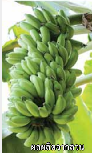
ผลผลิตจากสวน