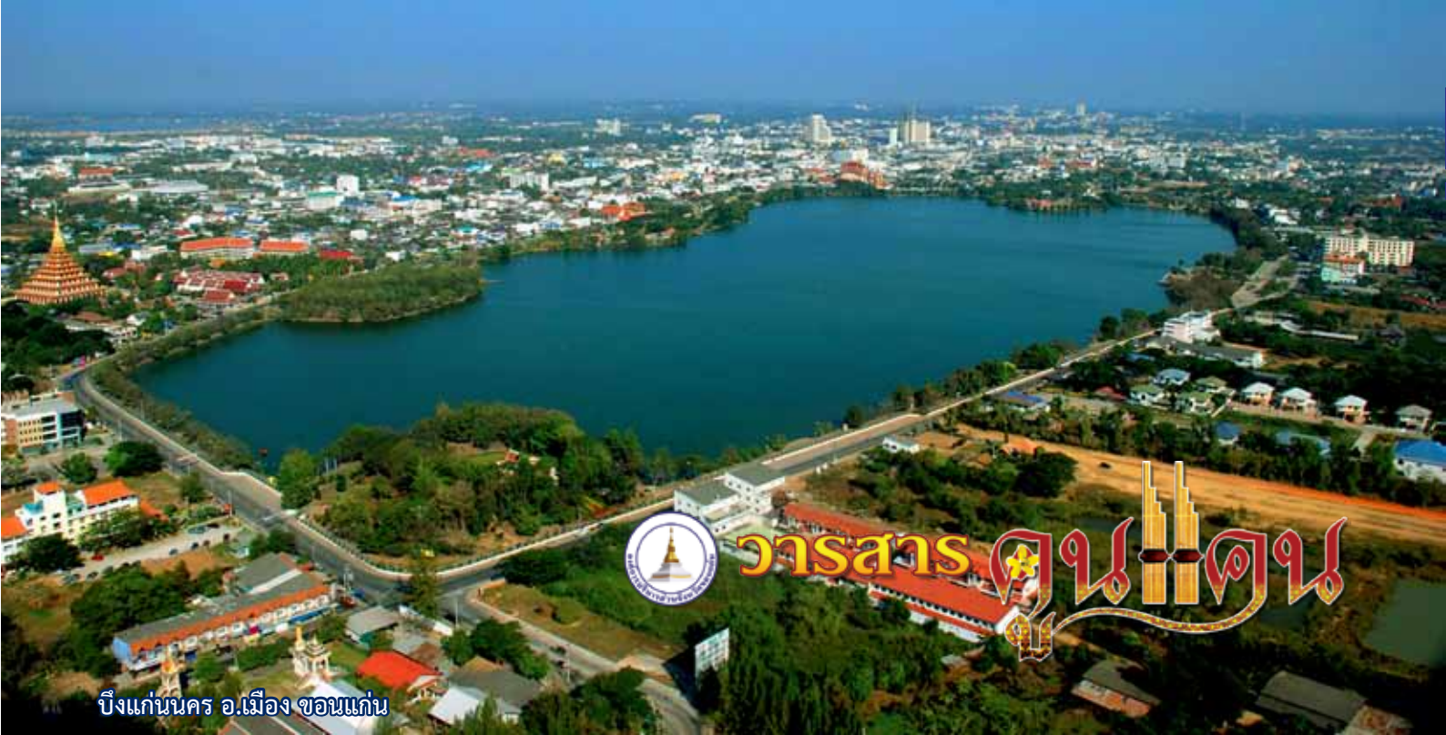
บึงแก่นนคร อ.เมือง ขอนแก่น