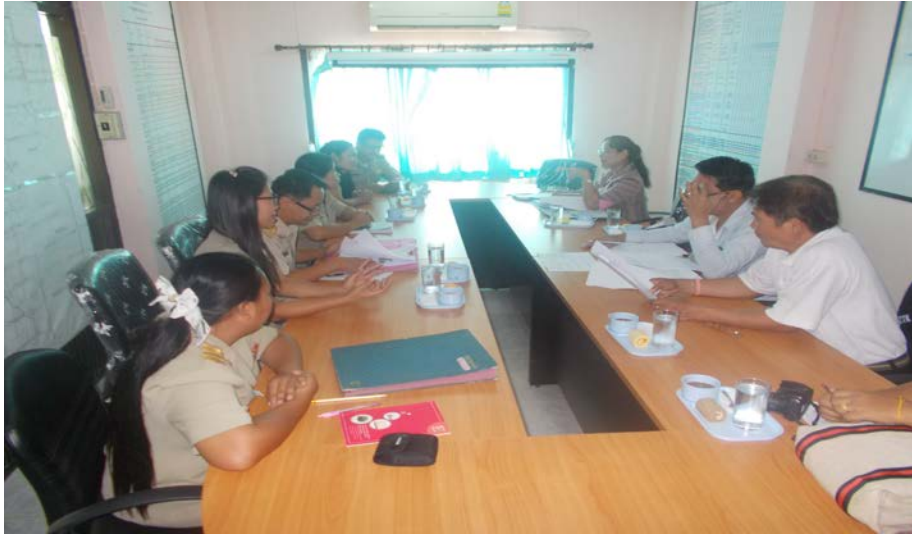
สำนักงานเทศบาล, องค์การบริหารส่วนตำบล