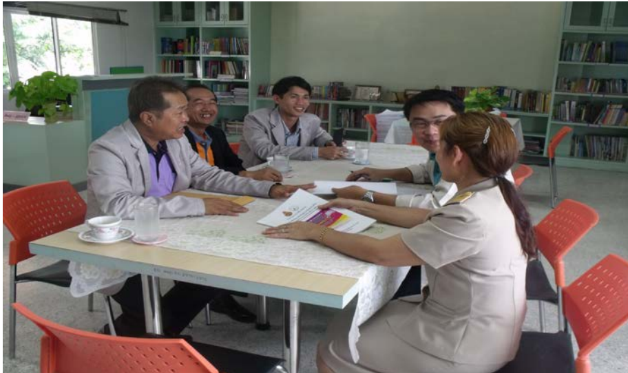
สำนักงานเขตพื้นที่การศึกษา เขต 5 อำเภอชุมแพ