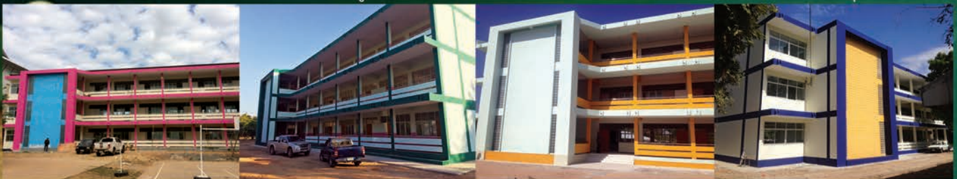
โรงเรียนพิศาลปทุมณวิทยา