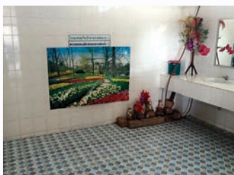
ก่อนซ่อม

สถานีขนส่งผู้โดยสารอำเภอภูเวียง ได้ปรับปรุงซ่อมแซมอาคารสถานีขนส่งผู้โดยสาร ประกอบด้วย งานทาสีอาคาร งานเปลี่ยนฝ้าเพดาน งานติดตั้งโคมไฟใหม่ งานทำเคาเตอร์ประชาสัมพันธ์