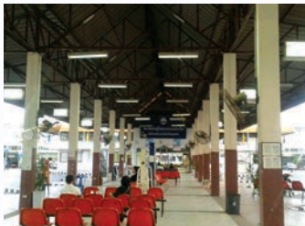
ก่อนซ่อม

สถานีขนส่งผู้โดยสารอำเภอบ้านไผ่ ได้ปรับปรุงซ่อมแซมอาคารสถานีขนส่งผู้โดยสาร ประกอบด้วย งานชุดสีเดิม ทำความสะอาดทาสีรองพื้นปูนเก่า และทาสีอะคริลิก รื้อถอนและเปลี่ยนฝ้าเพดานยิปซัมบอร์ด ทั้งภายนอกและภายใน