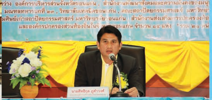
นาง อธิการบริหารส่วนจังหวัดขอนแก่น, สำนักงานพัฒนาสังคมและความมั่นคงของมนุษย์ มณฑลทหารบกที่ ๒๓, วิทยาลัยเทคนิคขอนแก่น, คณะสถาปัตยกรรมศาสตร์ มหาวิทยาลัยเทคโนโลยีพระจอมเกล้าธนบุรี, สำนักงานส่งเสริมการปกครองท้องถิ่น และองค์การปกครองส่วนท้องถิ่นในจังหวัดขอนแก่น จำนวน ๑๕ แห่ง "รวม ๒๑ หน่วยงาน"