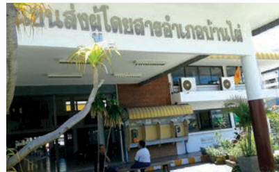
หลังซ่อม