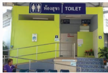
หลังซ่อม