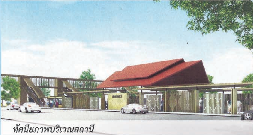
ทัศนียภาพบริเวณสถานี