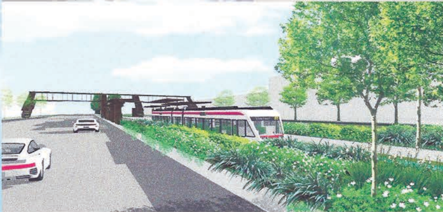
ทัศนียภาพภูมิทัศน์ตามแนวเส้นทางรถไฟฟ้ารางเบา