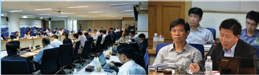
การประชุมคณะกรรมการฯ

ฉบับนี้ขอนำเสนอความคืบหน้าล่าสุดของ การศึกษาออกแบบรายละเอียดระบบขนส่งสาธารณะในเขต จ.ขอนแก่น และผลกระทบสิ่งแวดล้อม ที่สำนักงานนโยบายและแผนการขนส่งจราจร (สนข.) มอบหมายให้ศูนย์วิจัยและพัฒนาโครงสร้าง มูลฐานอย่างยั่งยืน มหาวิทยาลัยขอนแก่น จากการประชุมคณะกรรมการกำกับการศึกษาฯ ในวันที่ 29 ก.ค.2559 ณ อาคาร สนข. กรุงเทพฯ ที่ประชุมมีมติเห็นชอบให้ใช้ระบบ “รถไฟฟ้ารางเบา” (Light Rail Transit) เส้นทางนำร่องสำราญ-ท่าพระ ระยะทาง 23 กม. จำนวน 16 สถานี ตามแนว ถ.มิตรภาพ โดยเสนอให้เอกชนเป็นผู้ลงทุน เนื่องจากมีความเป็นไปได้ในการลงทุนมากที่สุด ไม่เป็นภาระกับภาครัฐในระยะยาว และเพิ่มโอกาสในการสร้างรายได้เชิงพาณิชย์และการพัฒนาพื้นที่โดยรอบ สถานี (Transit Oriented Development) กำหนดศึกษาแล้วเสร็จภายในต้นปี พ.ศ.2560