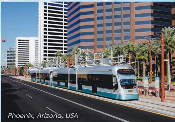
Phoenix, Arizona, USA