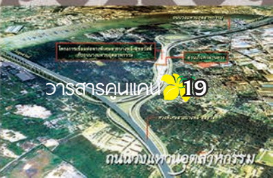
สะพานภูมิพล สะพานพระราม 8 ทางคู่ขนานลอยฟ้าบรมราชชนนี ถนนวงแหวนอุตสาหกรรม