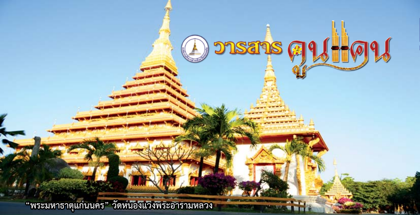
“พระมหาธาตุแก่นนคร” วัดหนองแวงพระอารามหลวง