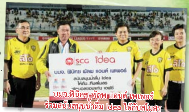
บมจ.ฟินิคซ์ พัลพ แอนด์ เพเพอร์ ร่วมสนับสนุนน้ำดื่ม Idea ให้กับสโมสร

ส่วนการแข่งขัน “ฟุตบอลมูลนิธิไทยคม เอฟเอคัพ 2012” รอบที่สาม จะทำการแข่งขันในวันพุธที่ 15 ส.ค.55 (เลื่อนจาก 1 ส.ค.55) โดยเปิดบ้านต้อนรับ “กว่างโซ้งมหาภัย” เชียงราย ยูไนเต็ต เวลา 18.00 น.