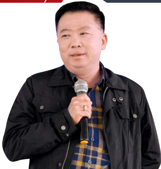
โครงการทดสอบการใช้ทักษะภาษาอาเซียน เพื่อการสื่อสาร