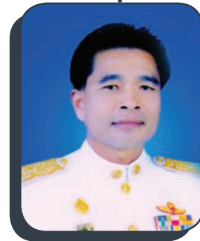
นายมีสวัสดิ์ ชมชัยภูมิ รองประธานสภาฯ คนที่ 2