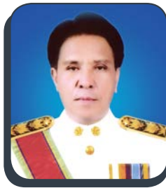
นายประเวศ เทศเจริญ พอ.สำนักการศึกษา ศาสนาและวัฒนธรรม