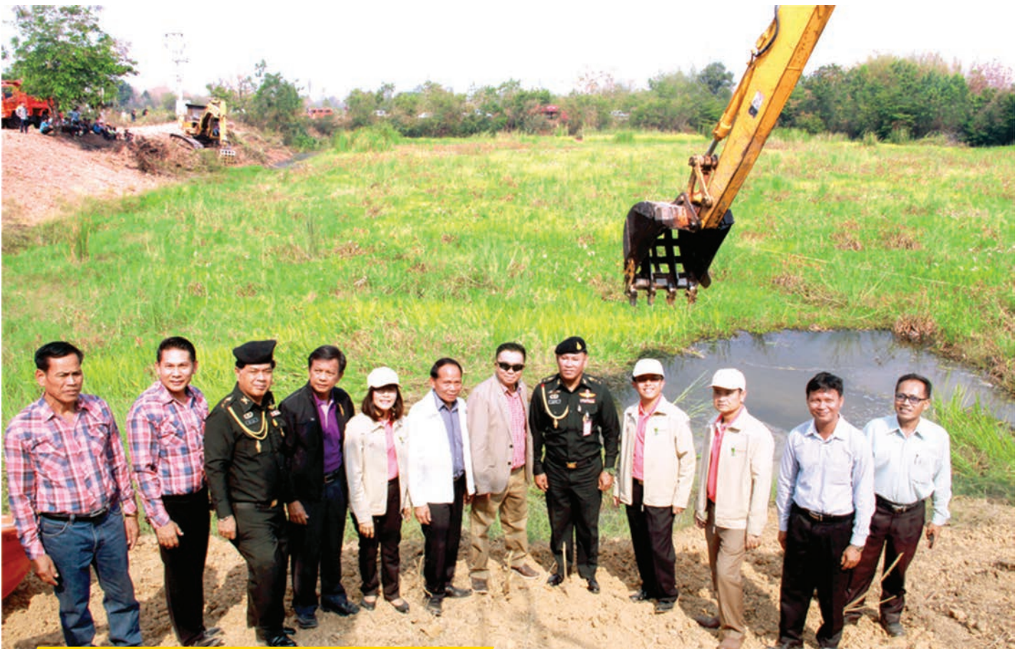
การขุดลอกกุดคลองเพื่อสนองนโยบาย คลองสวยน้ำใสของรัฐบาล