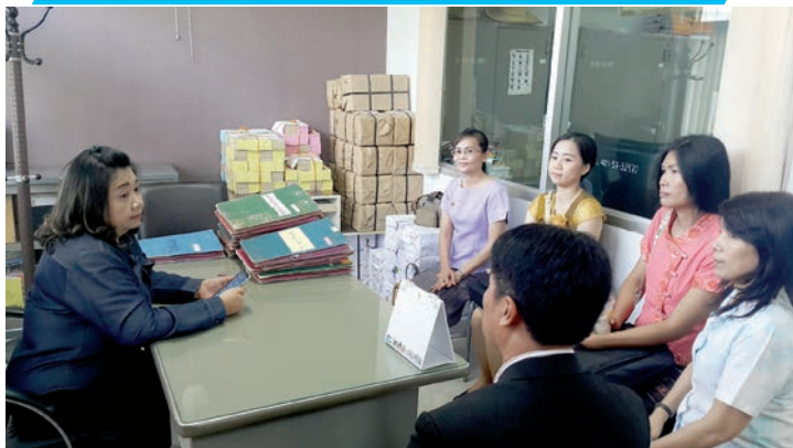
แนะนำการวัดซื้อจัดจ้าง