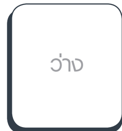
ว่าง อ.ชุมแพ เขต 1