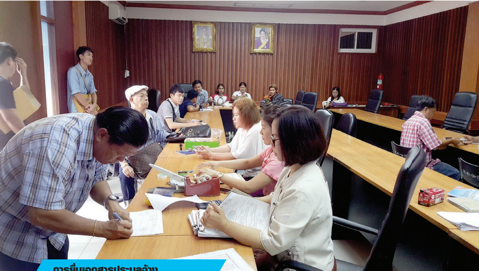
การยื่นเอกสารประมูลจ้าง