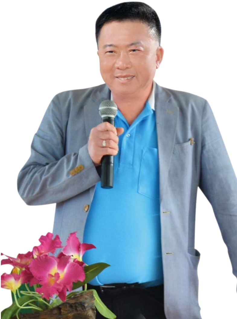
1 อำเภอ 1 หมู่บ้านเศรษฐกิจพอเพียง