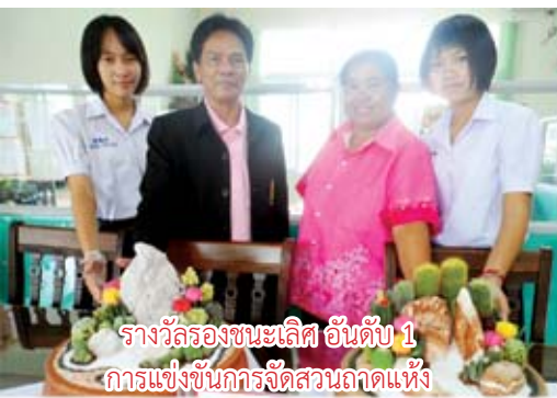
รางวัลรองชนะเลิศ อันดับ 1 การแข่งขันการจัดสวนถาดแห้ง