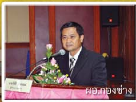
ผอ.กองช่าง