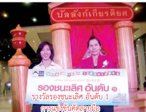
รางวัลรองชนะเลิศ อันดับ 1 การแข่งขันคัดลายมือ