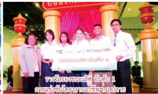
รางวัลรองชนะเลิศ อันดับ 1 การแข่งขันโครงการอาชีพฯ ม.ปลาย