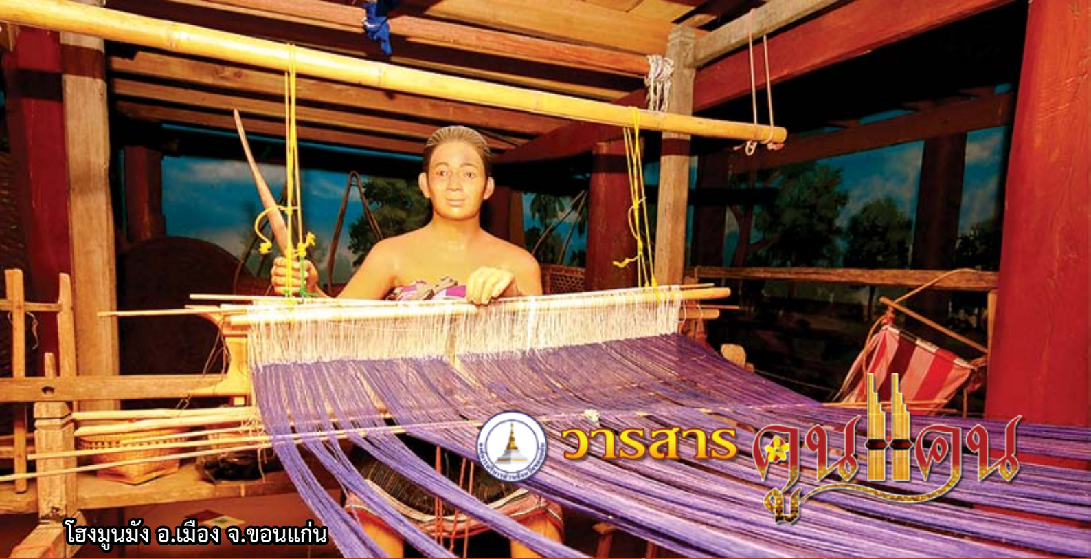
โธมมูมั่ง อ.เมือง จ.ขอนแก่น