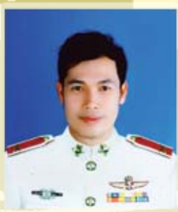
ส.อบจ.ขอนแก่น อ.อุบลรัตน์ เบอร์ 1 ต.ต.สุเมชิน รัตนไตรพันธ์ ได้คะแนน 8,507 คะแนน