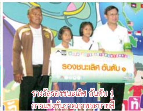
รางวัลรองชนะเลิศ อันดับ 1 การแข่งขันวาดภาพระบายสี