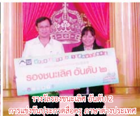
รางวัลรองชนะเลิศ อันดับ 2 การแข่งขันประกวดสื่อครู ภาษาต่างประเทศ