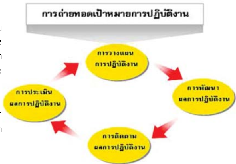
ระบบบริหารผลการปฏิบัติงาน

สำนักงาน ก.พ. ได้ทดลองใช้ระบบนี้ในส่วนราชการมาตั้งแต่ปี 2548 และได้เห็นผลการดำเนินการที่น่าพอใจ จึงได้นำหลักการและแนวคิดการบริหารผลการปฏิบัติราชการ (Performance Management) หรือ PM มาเป็นกรอบในการร่างพระราชบัญญัติระเบียบข้าราชการพลเรือนฉบับใหม่ รวมทั้ง วิธีการปฏิบัติงานที่สนับสนุนให้ข้าราชการสามารถปฏิบัติงานอย่างมีประสิทธิภาพสูงสุด