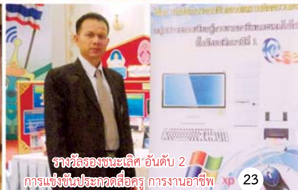
รางวัลรองชนะเลิศ อันดับ 2 การแข่งขันประกวดสื่อครู การงานอาชีพ