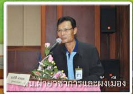
ทน.ฝ่ายวิชาการและผังเมือง