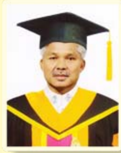
ส.อบจ.ขอนแก่น อ.หนองนาคำ เบอร์ 1 ต.ต.พิชิต ศรีวิไล ได้คะแนน 5,498 คะแนน