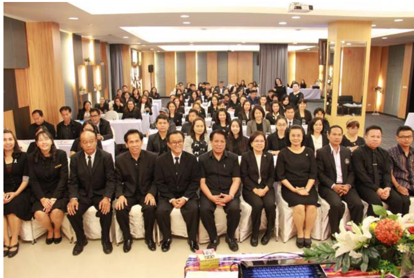
โครงการอบรมคุณธรรมนำชีวิต 4.0